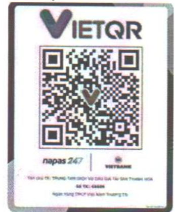
(Mã QR nộp tiền mua hồ sơ mời tham gia đấu giá và tiền đặt trước)

3. Xử lý tiền đặt trước: Trường hợp trúng đấu giá thì khoản tiền đặt trước được chuyển thành tiền đặt cọc để bảo đảm thực hiện giao kết hoặc thực hiện Hợp đồng mua bán tài sản đấu giá hoặc thực hiện nghĩa vụ mua tài sản đấu giá sau khi được cơ quan có thẩm quyền phê duyệt. Việc xử lý tiền đặt cọc thực hiện theo quy định của pháp luật về dân sự và quy định khác của pháp luật có liên quan.